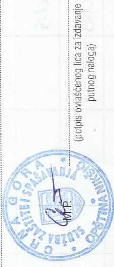
(potpis ovlaštenog lica za izdavanje putnog naloga)

Vrijeme važenja putnog naloga: 23.01 - 29.01.2025